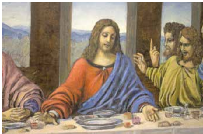
Un particolare dell'opera